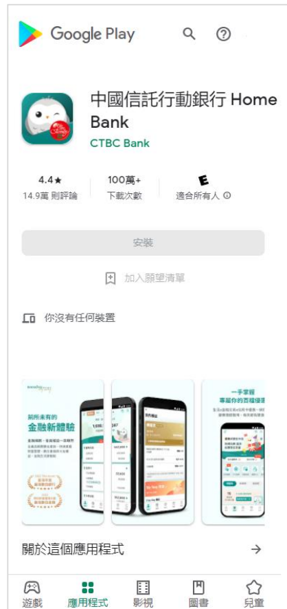
Google Play 商店